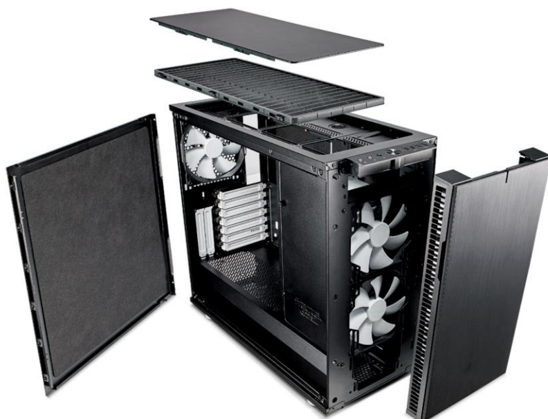
Slika 7: Eno najboljših ohišij na trgu, Fractal Design Define R6

Dobro ohišje vpliva tudi na glasnost sistema. Z ohišjem, ki podpira 120 ali 140mm ventilatorje in dušenje trdih diskov, lahko dosežemo nižjo glasnost sistema in s tem prijetnejšo uporabo.