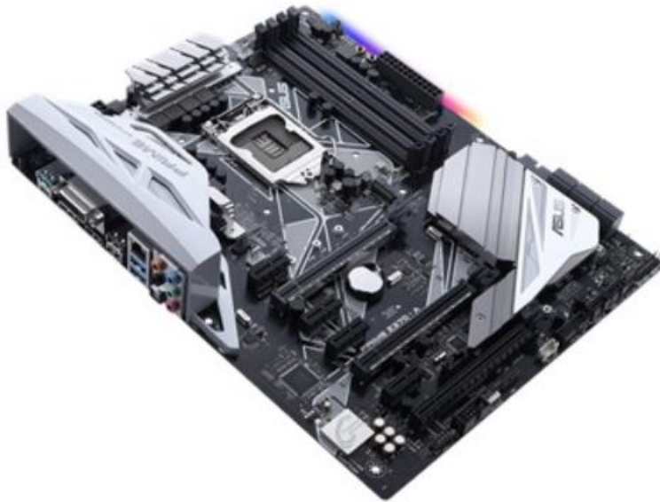
Slika 3: Matična plošča Asus Prime Z370-A za Intel Core i7-8700K