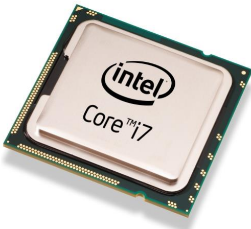
Slika 1: Procesor Intel Core i7

Cenovno ugodna alternativa za te aplikacije so postavili AMD procesorji Ryzen in Threadripper.