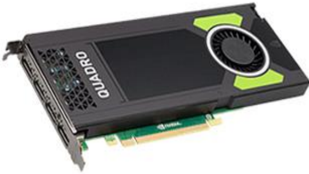
Slika 4: Grafična kartica nVidia Quadro P4000

Kartice AMD Radeon (brez Pro) ne priporočamo za delo s Creo Parametric, predvsem zaradi slabih izkušenj z njimi v preteklosti. Sicer za njih veljajo enake omejitve kot za kartice GeForce.