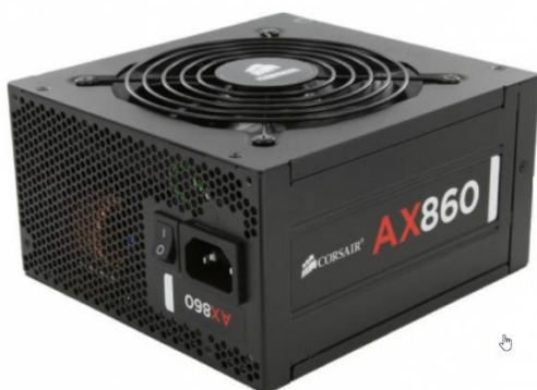
Slika 6: Odličen napajalnik Corsair AX 860