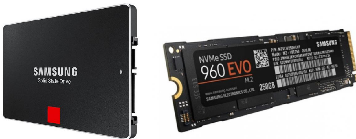
Slika 5: SSD diska Samsung 860 Pro in M.2 kartica Samsung 960 EVO.

Za večjo varnost večina novih sistemskih naborov podpira delovanje dveh ali več diskov v konfiguraciji RAID, torej v t.i. »fault tolerant« konfiguraciji, ki je odporna na napake, kot je odpoved diska. Za delovne postaje je najbolj uporabna konfiguracija RAID1, to je zrcaljenje diskov. Potrebujemo dva (najbolje enaka) diska, ki jih namestimo kot polje RAID1. V operacijskem sistemu oba diska vidimo kot en disk. Tudi velikost polja je enaka velikosti enega diska. Vse zapisovanje na disk se vrši na oba diska hkrati, vsebina obeh diskov je enaka in se zrcali v realnem času. Če en disk odpove, sistem normalno deluje naprej z drugega diska, medtem pa imamo čas, da pokvarjeni disk nadomestimo z novim. Ko to storimo, se vsebina samodejno prezrcali na nov disk. Hitrost pisanja na polje RAID1 je praktično enaka hitrosti enega diska, branje pa je običajno hitrejše.